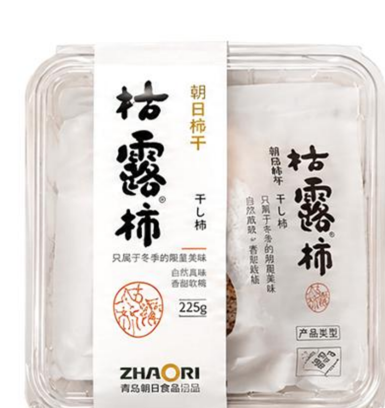
B-02-02 桔露柿 125克/盒 (4粒装)