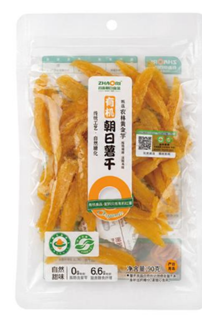
08-01-04 有机农林黄金-小片小条 90克/袋