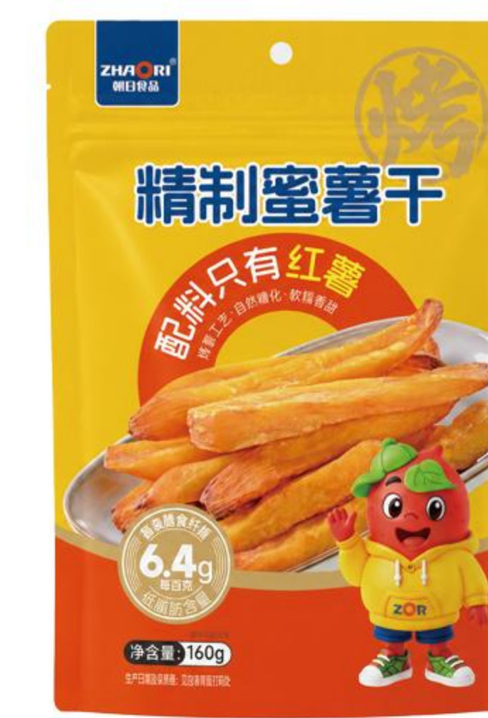
09-04-01 精制蜜薯干 (烤薯条) 160克/袋