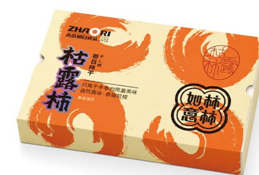
B-02-02 桔露柿 498克/盒(12粒装)