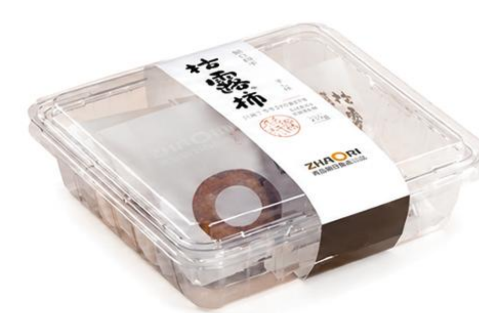
B-02-02 桔露柿 375克/盒 (125克*3)