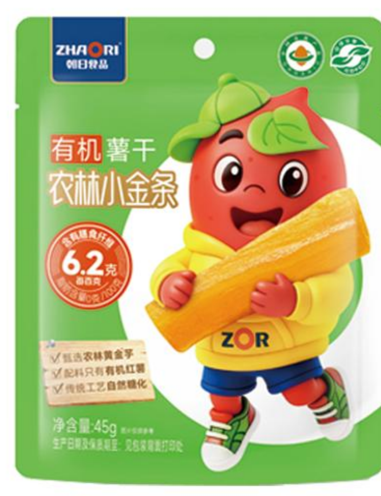
08-01-02 有机薯干-农林小金条 45克/袋