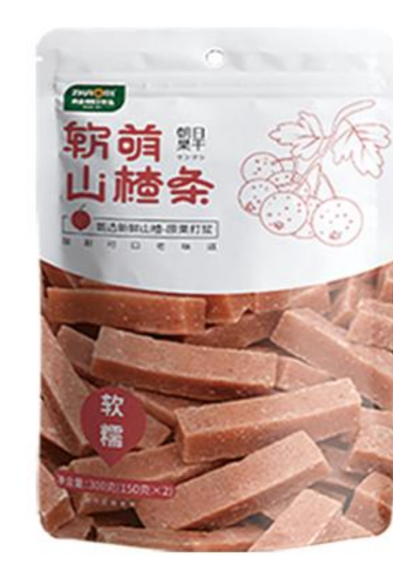
B-01-01 软萌山楂条 300克/袋 (150克*2)