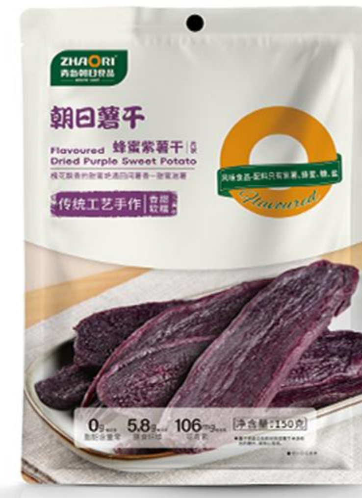
04-03-01 蜂蜜紫薯干-片 150克/袋