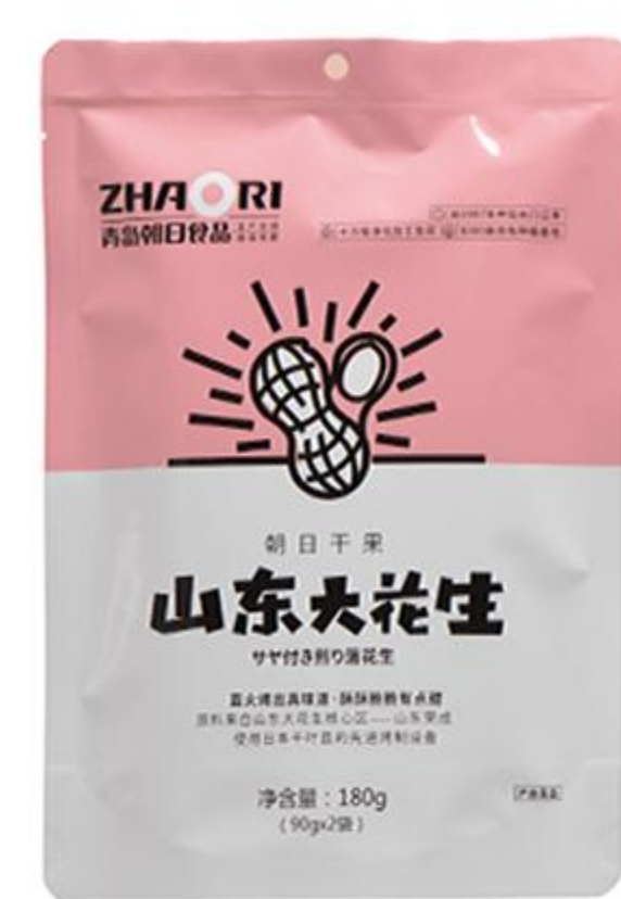
A-01-01 香脆山东大花生果 180克/袋 (90克*2)