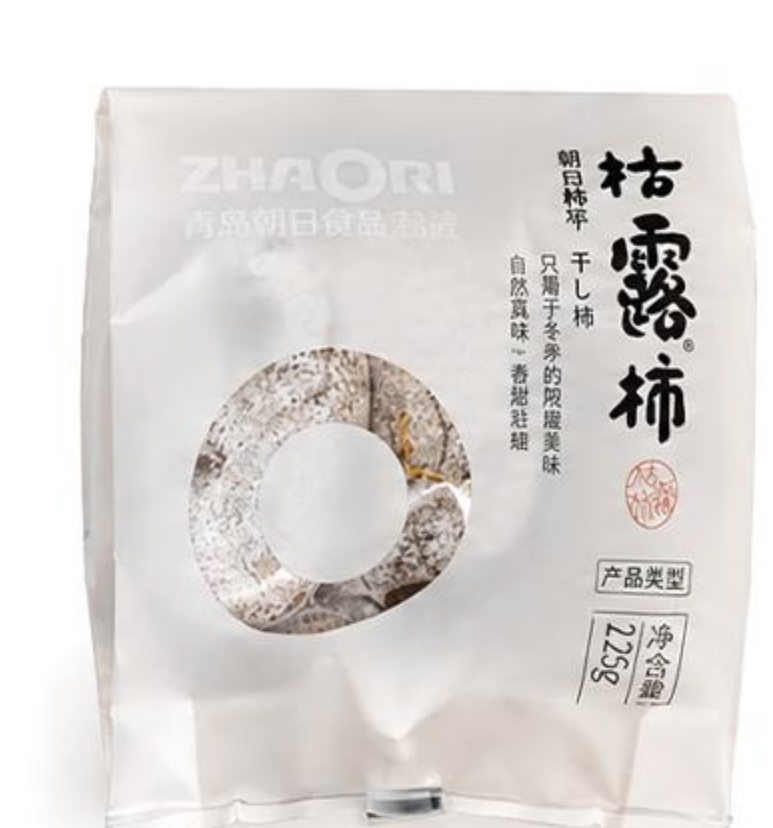
B-02-02 桔露柿 125克/袋 (4粒装)