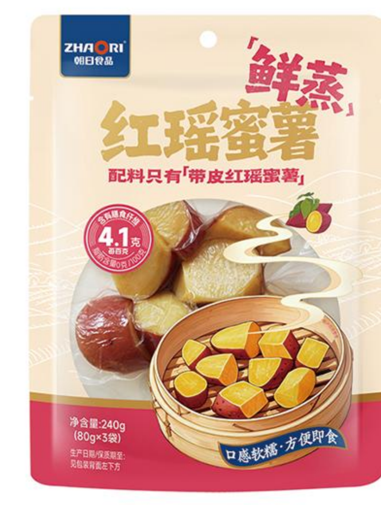
08-04-04 红瑶蜜薯 鲜蒸 240克/袋 (80克*3)