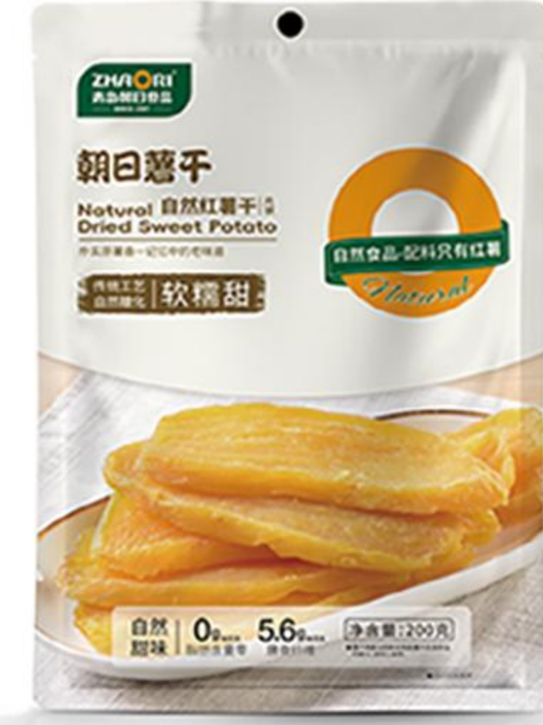
09-03-01 自然红薯干-片 200克/袋