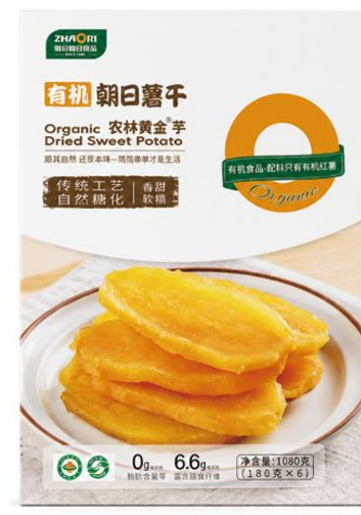
08-01-01 有机薯干-农林黄金-片 1080克(180克*6)