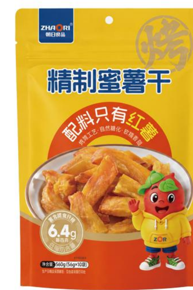
09-04-01 精制蜜薯干 (烤薯条) 560克/袋(80克*7)