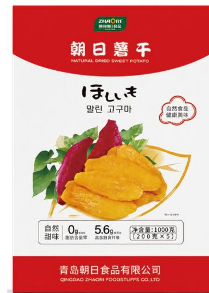
09-03-01 自然红薯干-片 1000克/盒(200克*5)