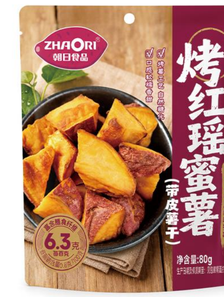
08-04-03 烤红瑶蜜薯 80克/袋