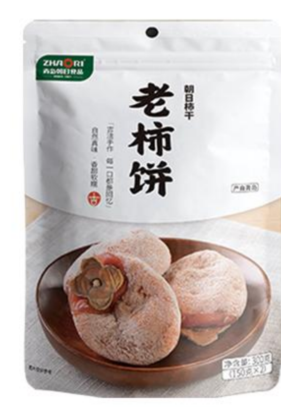
B-02-01 老柿饼 300克/袋 (150克*2)