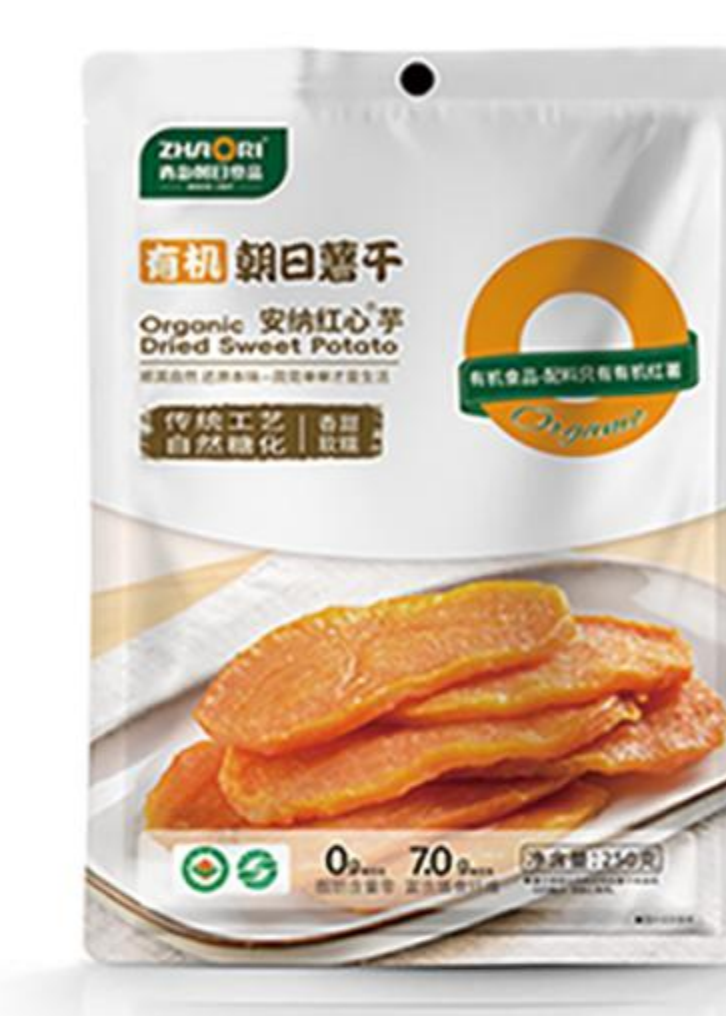
10-01-01 有机安纳红心芋-大片 250克/袋