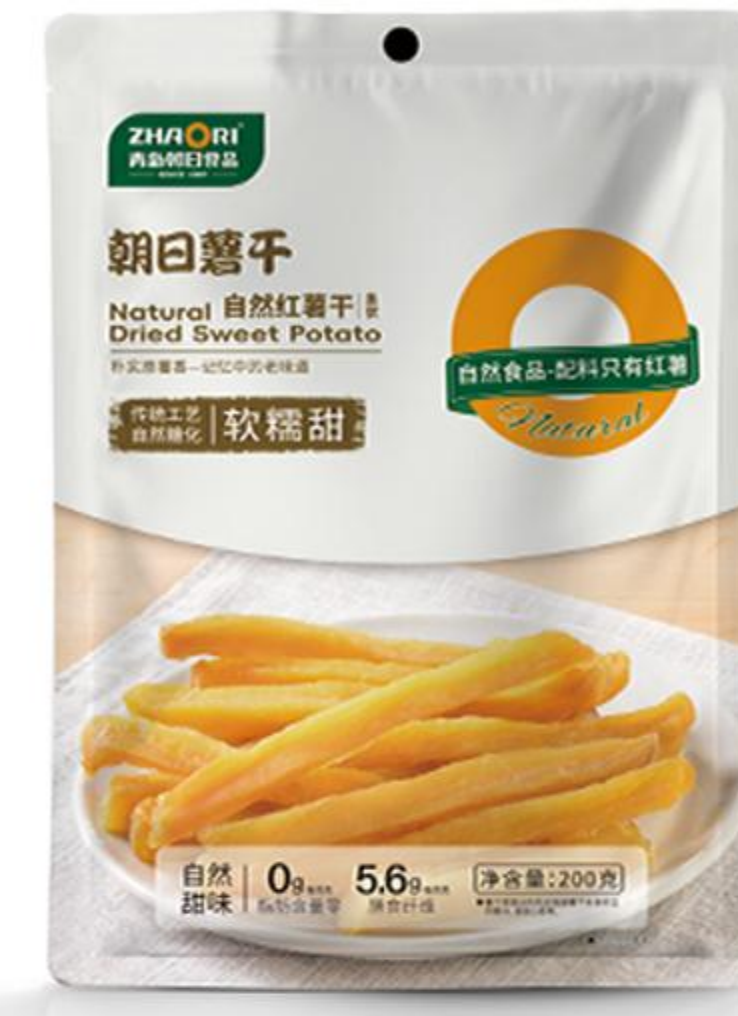
09-03-01 自然红薯干-条 200克/袋