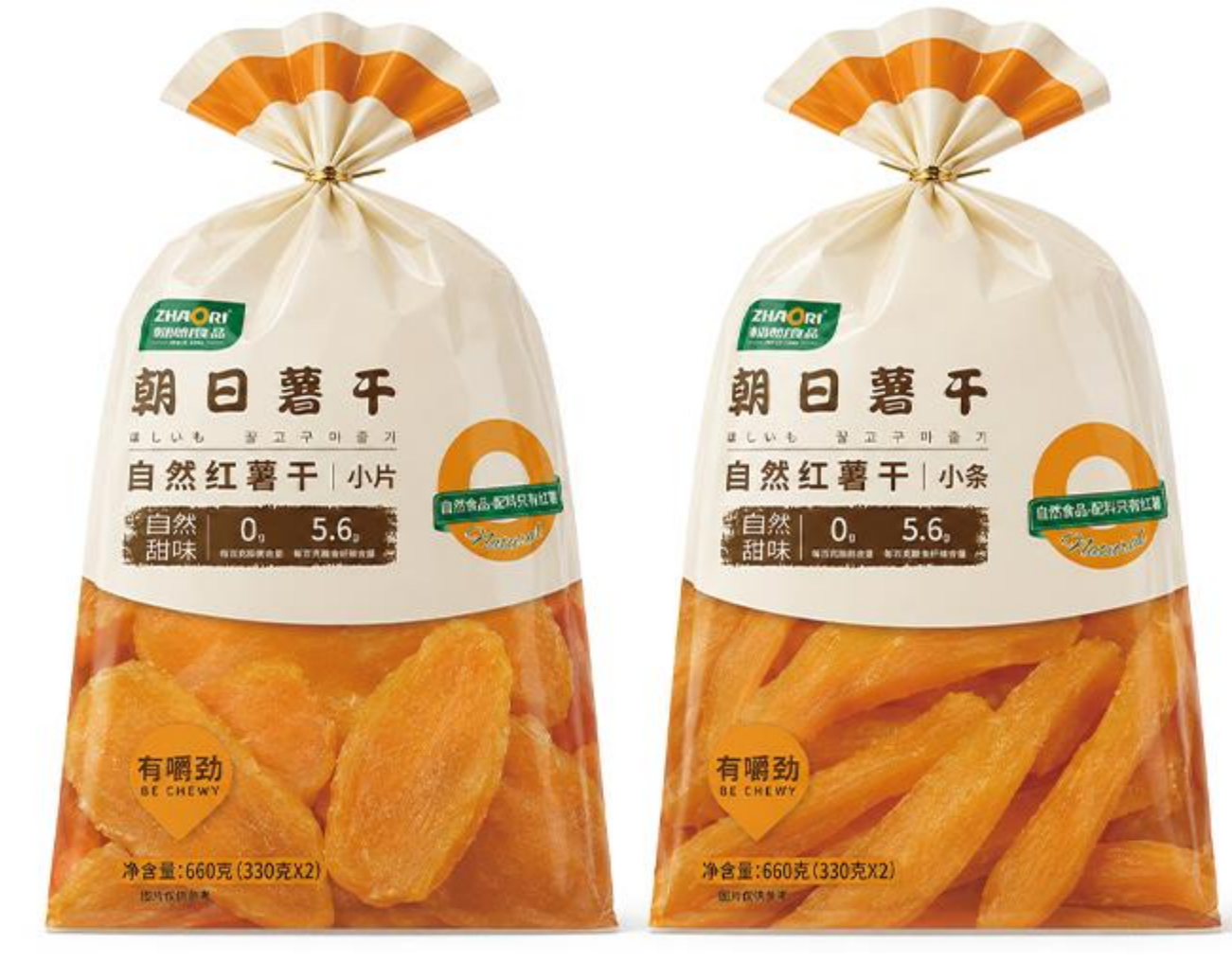
09-03-03 自然红薯干-小片小条 660克/袋 (330克*2)