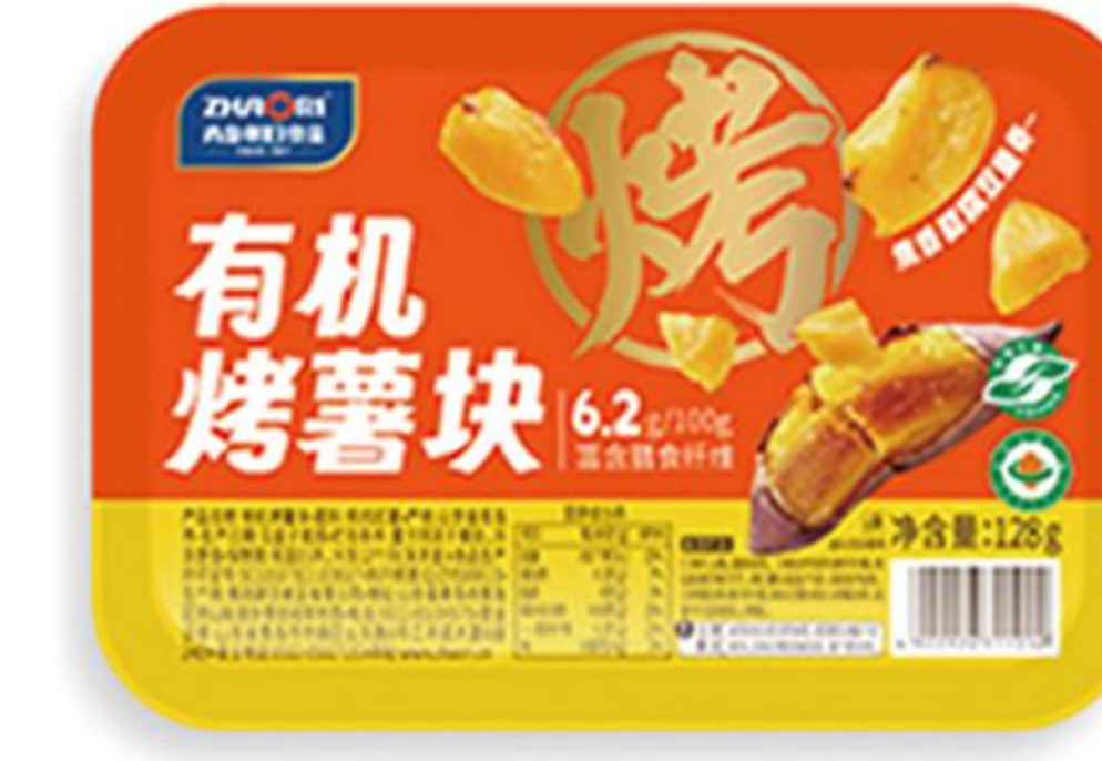
08-02-01 有机烤薯块 128克/盒