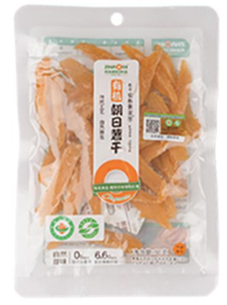
10-01-02 有机安纳红心芋-小片 100克/袋