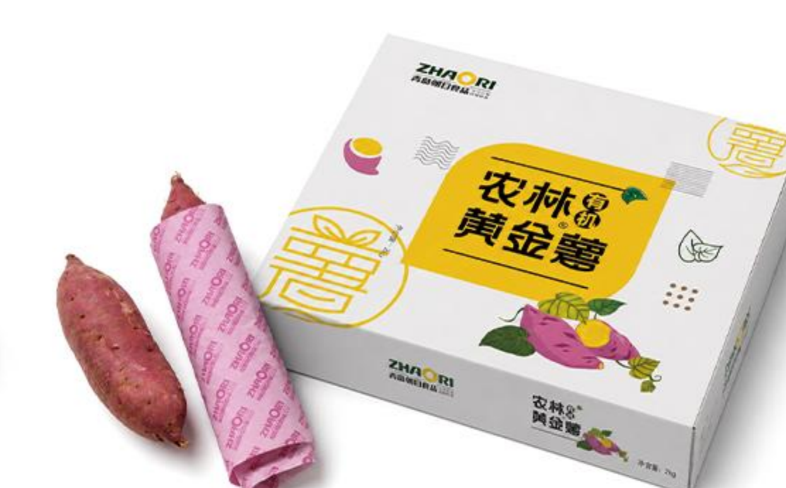
C-01-02 有机农林黄金薯规格薯 2公斤/盒