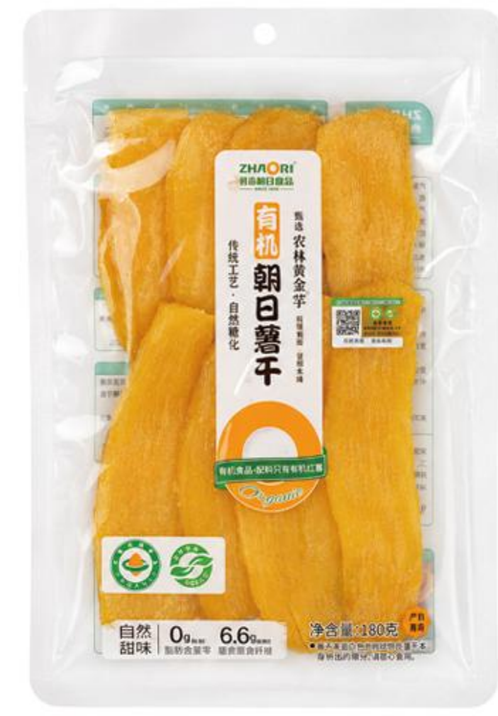
08-01-01 有机薯干-农林黄金-片 180克