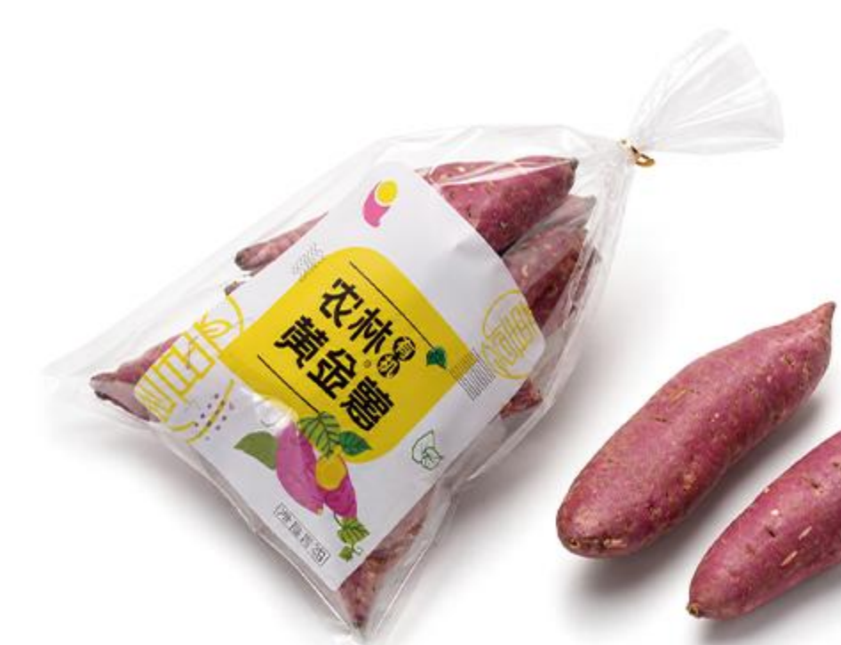
C-01-01 有机农林黄金薯小薯 1公斤/袋